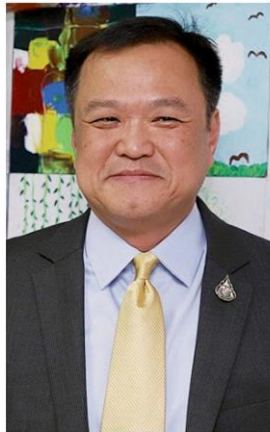
อนุทิน ชาญวีรกูล