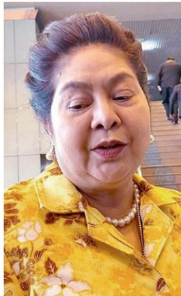
นาที รัชกิจประการ