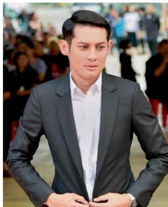
พิชณู พลธี

●...ครางฮือตามๆ กัน เมื่อ “ป.ป.ช.” เปิดเผยต่อสาธารณะ ถึง “บัญชีทรัพย์สินและหนี้สิน” ของบรรดาสมาชิกสภาผู้แทนราษฎร หรือ ส.ส.ผู้ทรงเกียรติ ลีดแรกจำนวน 414 ราย พบว่ารายอยู่คู่กันมากหน้าหลายตา ตามสถิติปรากฏว่า นางนาที รัชกิจประการ คู่สมรส พิพัฒน์ รัชกิจประการ รัฐมนตรีว่าการกระทรวงการท่องเที่ยวและกีฬา ครองแชมป์ มีทรัพย์สินสูงสุด 4,674 ล้านบาท เสียหนุ-อนุทิน ชาญวีรกูล หัวหน้าพรรค รัฐมนตรีว่าการกระทรวงสาธารณสุข แจ้งว่า ยังหนุ่มโสด มีทรัพย์สินตามมามาติดๆ 4,248 ล้านบาท เป็นเงินฝากและเงินลงทุน กะพาหนะอีกนับไม่ถ้วน ทั้งรถยนต์หรู เรือยนต์ และเครื่องบินเจ็ต 2 ลำ