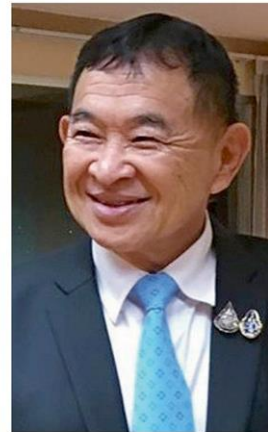
วีรศักดิ์ หวังศุกกิจโกศล

●...ครางฮือตามๆ กัน เมื่อ “ป.ป.ช.” เปิดเผยต่อสาธารณะ ถึง “บัญชีทรัพย์สินและหนี้สิน” ของบรรดาสมาชิกสภาผู้แทนราษฎร หรือ ส.ส.ผู้ทรงเกียรติ ลีดแรกจำนวน 414 ราย พบว่ารายอยู่คู่กันมากหน้าหลายตา ตามสถิติปรากฏว่า นางนาที รัชกิจประการ คู่สมรส พิพัฒน์ รัชกิจประการ รัฐมนตรีว่าการกระทรวงการท่องเที่ยวและกีฬา ครองแชมป์ มีทรัพย์สินสูงสุด 4,674 ล้านบาท เสียหนุ-อนุทิน ชาญวีรกูล หัวหน้าพรรค รัฐมนตรีว่าการกระทรวงสาธารณสุข แจ้งว่า ยังหนุ่มโสด มีทรัพย์สินตามมามาติดๆ 4,248 ล้านบาท เป็นเงินฝากและเงินลงทุน กะพาหนะอีกนับไม่ถ้วน ทั้งรถยนต์หรู เรือยนต์ และเครื่องบินเจ็ต 2 ลำ